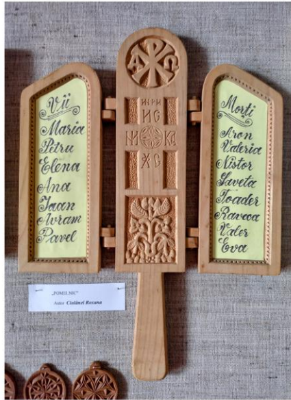
"PAMELNIC" Autor: Catalina Roxana