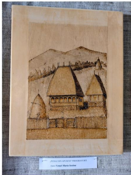
"PANAILEA BUCURIEI ZIGORAVILKA" Autor: Vasile Maria Simona