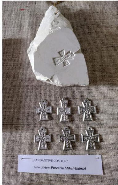
"PANDANTIVE COSITOR" Autor: Arion-Purcariu Mihai-Gabriel